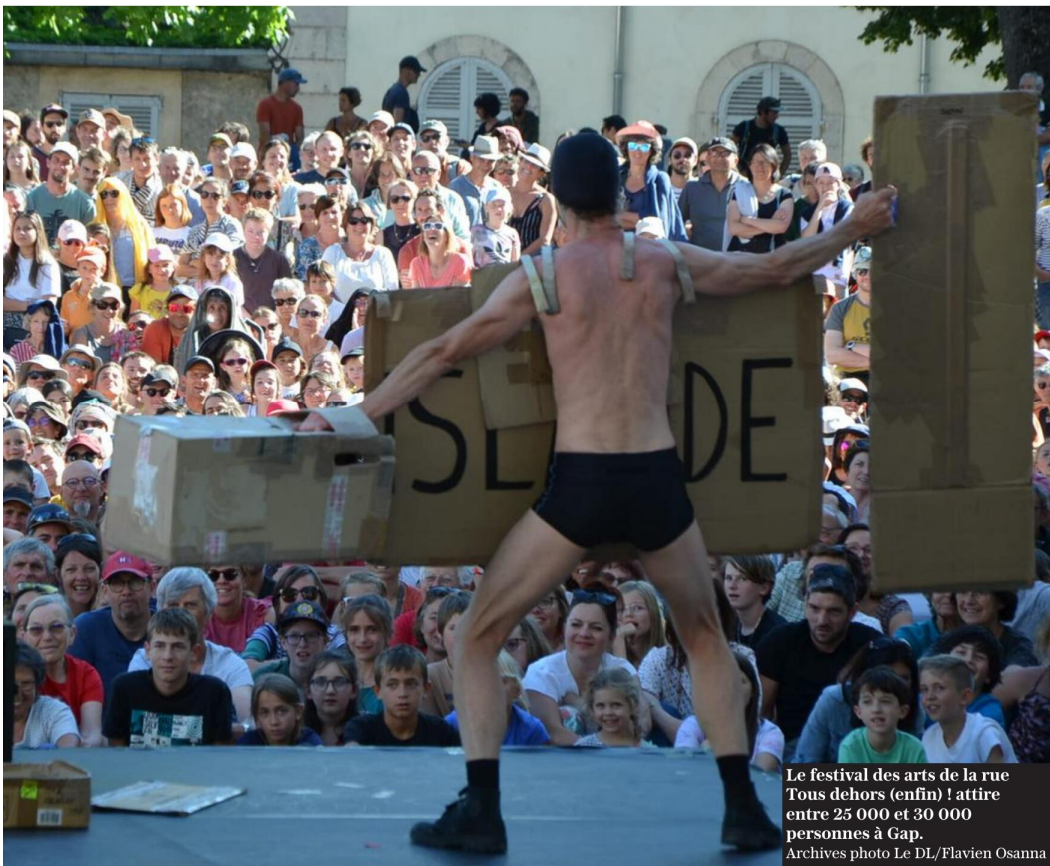
Le festival des arts de la rue Tous dehors (enfin) ! attire entre 25 000 et 30 000 personnes à Gap.