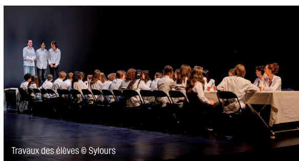
Travaux des élèves

Cet événement fait suite à des ateliers menés tout au long de l'année au sein de ces établissements par les professeurs de lettres, en lien avec les metteuses en scène Lucile Jourdan (Cie Les Passeurs) et Cécile Brochoire (Cie Chabraque).