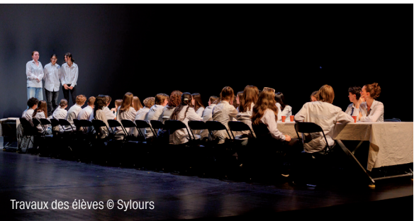
Travaux des élèves

Cet événement fait suite à des ateliers menés tout au long de l'année au sein de ces établissements par les professeurs de lettres, en lien avec les metteuses en scène Lucile Jourdan (Cie Les Passeurs) et Cécile Brochoire (Cie Chabraque).