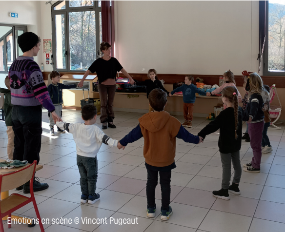
Emotions en scène

Cette semaine d'immersion s'est conclue par la venue de l'école à La Passerelle. Les élèves ont alors pu visiter et découvrir les coulisses du théâtre, et assister au spectacle Kouak de la comédienne et musicienne Anabelle Galat-Zarow.