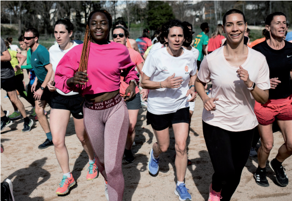
© Ballet Jogging - une création de Pierre Rigal / cie dernière minute & LE ZEF - scène nationale de Marseille © Yohanne Lamoulère - Tendance Floue...

Prêt-es pour le défi sportif et artistique ? Suivez le plan d'entraînement sur notre site.