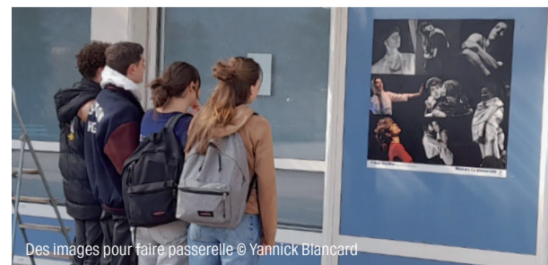
Des images pour faire passerelle