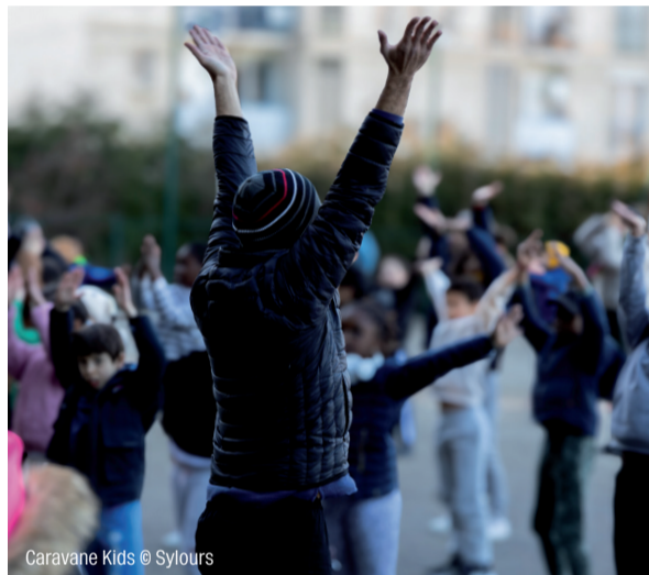
Caravane Kids

Ces journées, offrent aux élèves l'occasion de vivre une expérience poétique, sensible et artistique autour de la danse. En favorisant les rencontres entre élèves en situation de handicap et élèves du milieu ordinaire, Caravane Kids affirme également une volonté de rendre la culture accessible à toutes et tous.