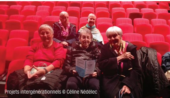
Projets intergénérationnels

Céline Nédélec, chargée des relations avec les publics 07 82 46 04 22