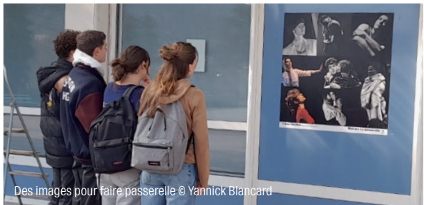
Des images pour faire passerelle

Le théâtre La Passerelle propose un projet photographique itinérant et gratuit pour les structures accueillantes. Chaque mois, une sélection de photographies prises par Yannick Blancard - L'œil témoin (photographe complice du théâtre), issues des spectacles de la saison 25/26 (répétitions, résidences, coulisses, représentations) sera exposée dans des lieux inattendus comme les espaces publics, les établissements scolaires, des lieux sociaux, des structures de formation... Ces installations éphémères invitent à regarder autrement la création artistique, à susciter la curiosité, les échanges et les rencontres. Après le Stade nautique de Fontfreyne à Gap investi en janvier, découvrez ces expositions temporaires en février dans les locaux de la Croix-Rouge et en mars au CHICAS de Gap. D'autres lieux sont en préparation.