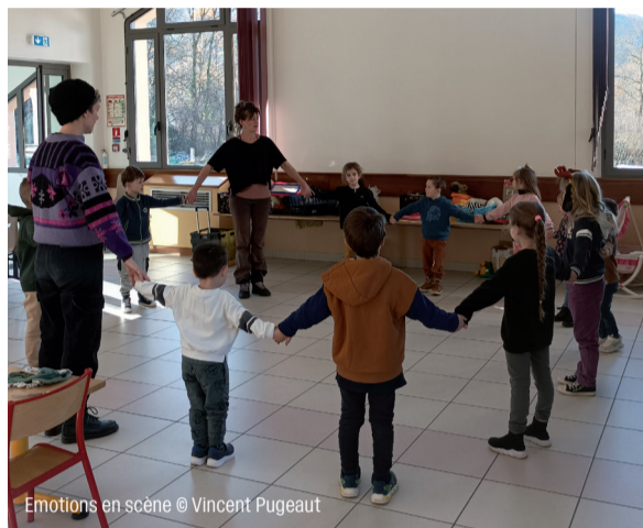
Emotions en scène

Cette semaine d'immersion s'est conclue par la venue de l'école à La Passerelle. Les élèves ont alors pu visiter et découvrir les coulisses du théâtre, et assister au spectacle Kouak de la comédienne et musicienne Anabelle Galat-Zarow.