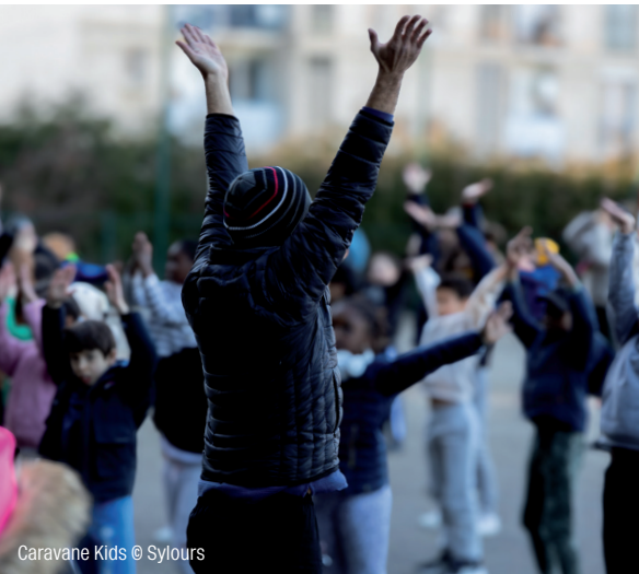
Caravane Kids

Ces journées, offrent aux élèves l'occasion de vivre une expérience poétique, sensible et artistique autour de la danse. En favorisant les rencontres entre élèves en situation de handicap et élèves du milieu ordinaire, Caravane Kids affirme également une volonté de rendre la culture accessible à toutes et tous.