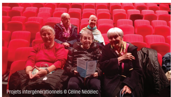
Projets intergénérationnels

Céline Nédélec, chargée des relations avec les publics 07 82 46 04 22