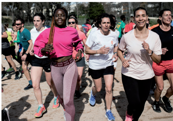
© Ballet Jogging - une création de Pierre Rigal / cie dernière minute & LE ZEF - scène nationale de Marseille © Yohanne Lamoulière - Tendance Floue...

Prêt-es pour le défi sportif et artistique ? Suivez le plan d'entraînement sur notre site.